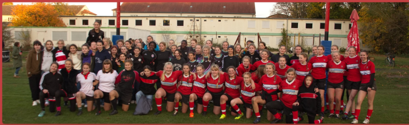
GRRLS Tag in Potsdam